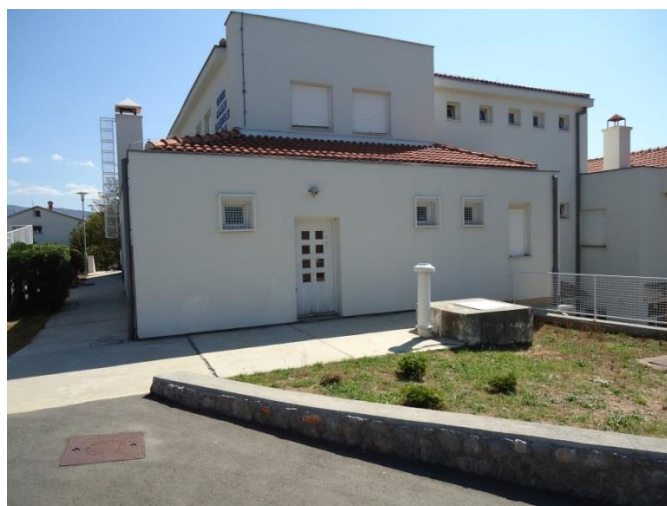
Slika 4. Istočno pročelje