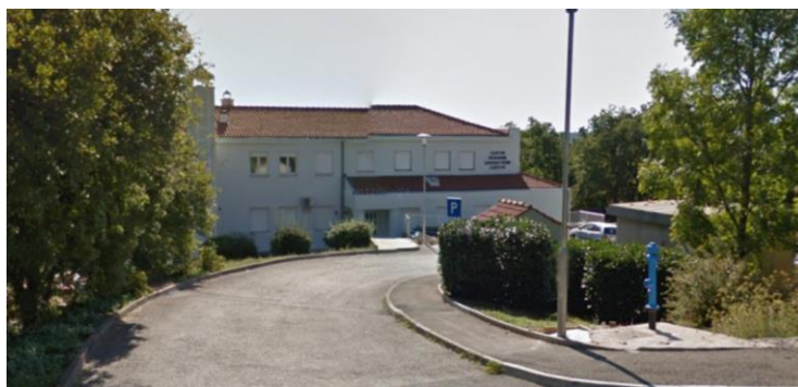
Slika 3. Sjeverno pročelje

Arhitektonsko oblikovanje građevine i građevinski materijali su primjereni tipologiji krajolika, a korištene su osobitosti i elementi autohtonog izraza, tj. karakteristični za tradicionalnu arhitekturu ovog kraja. Horizontalni i vertikalni gabariti građevine, oblikovanje pročelja i krovišta, te upotrijebljeni materijali usklađeni su s okolnim građevinama i lokalnim uvjetima primorskog prostora. Prozori su u pravilu viši nego širi. Na kosom terenu sljeme krova je usporedno sa slojnicama zemljišta. Krovište je koso s pokrovom od mediteran crijepa, a nagib je 19°.