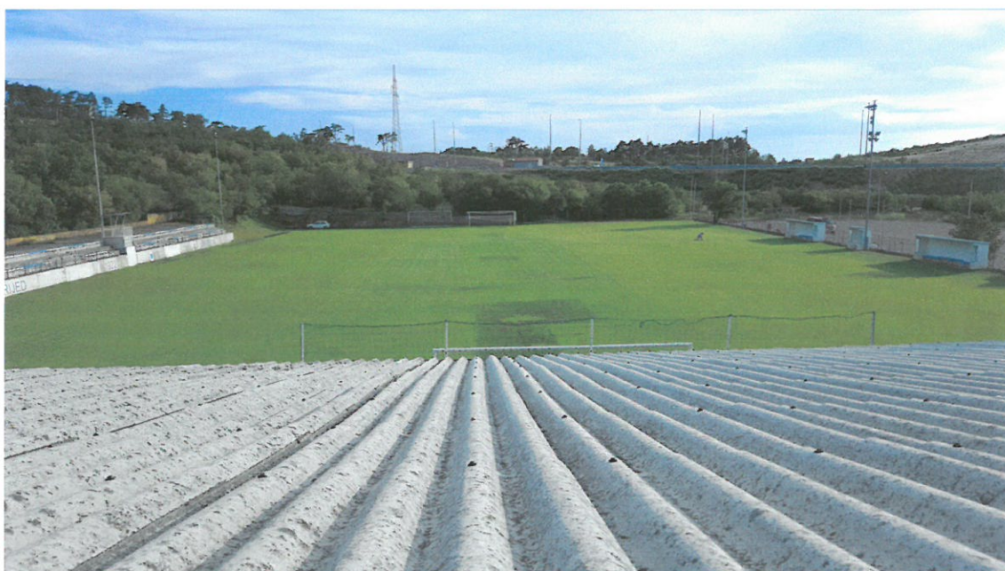
Slika br.2: Pogled sa ravnog krova skladišta