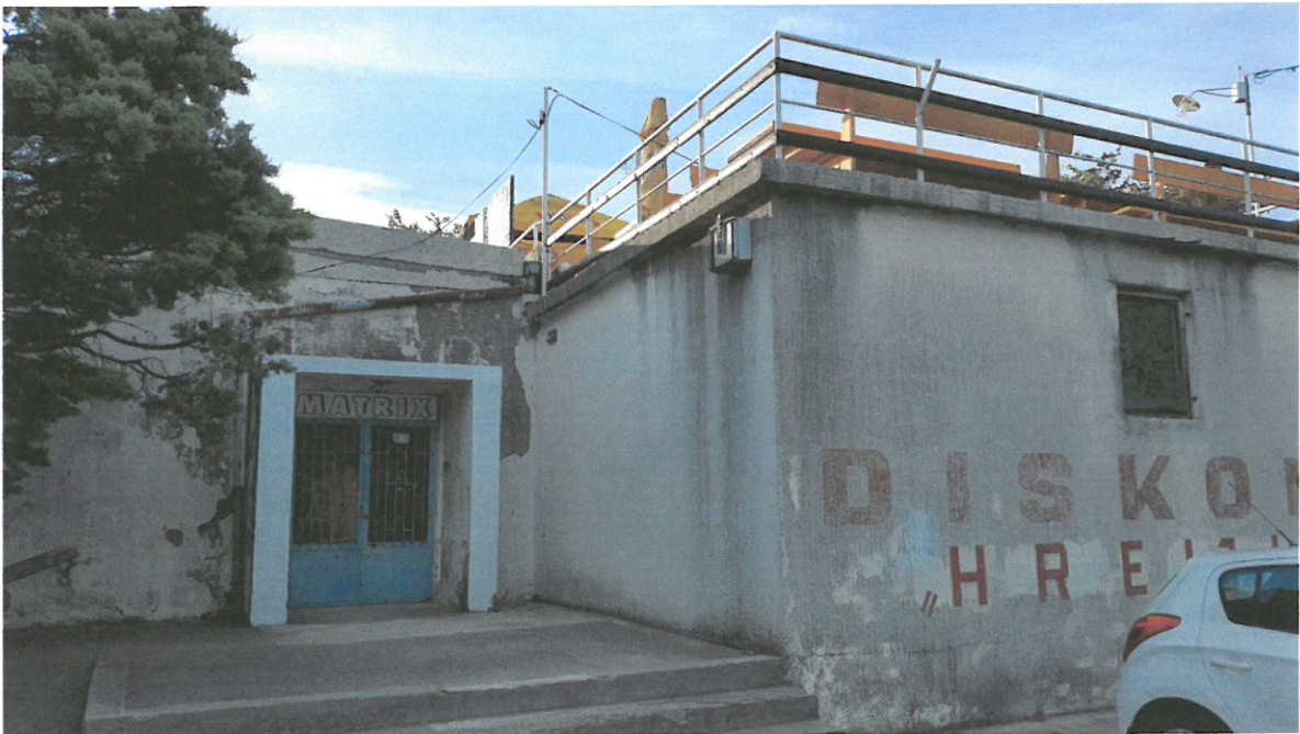
Slika br.6: Pogled na istočno pročelje zgrade nogometnog kluba