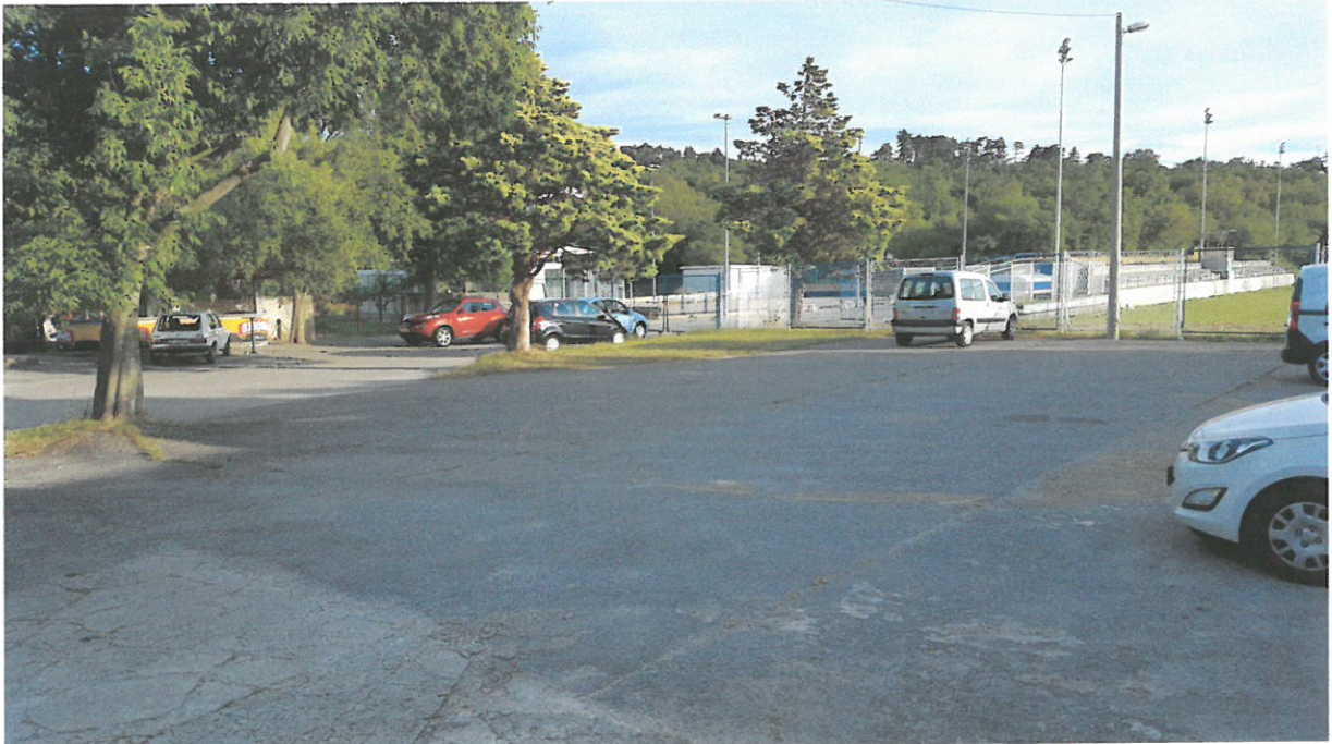
Slika br.7: Pogled na parkiralište sa istočne strane zgrade nogometnog kluba