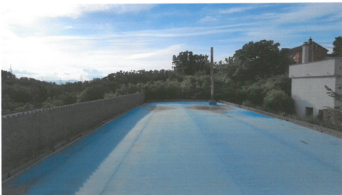
Slika br.4: Pogled na ravni krov iznad skladišta