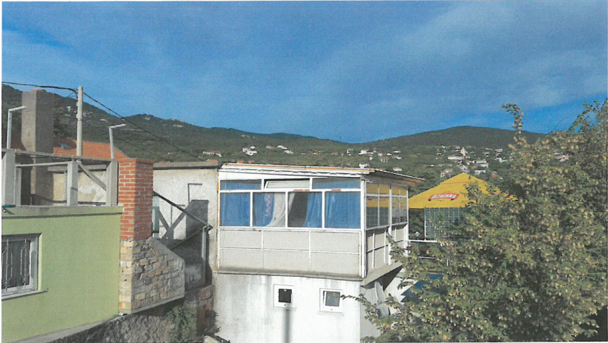
Slika br.5: Pogled na ugostiteljski objekt