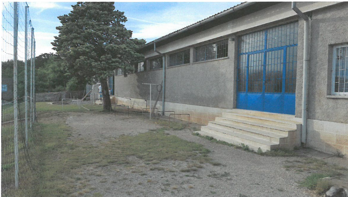
Slika br.1: Zgrada nogometnog kluba